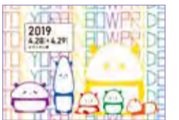
「RAINBOW PANDA」 オーディション作品