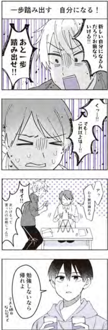
制作/窪田 榛名 (マンガ・キャラクターコース) 4コマ漫画のコーナーは、美術学科学生の有志によって制作されています。同コースでは遊学館高等学校ホームページ「遊Yuコミック」での4コマ漫画の定期連載やイベントでの似顔絵描き、加賀千代女をテーマにしたアニメーション制作 (YOUTUBEにて配信) 等、幅広く活動しています。