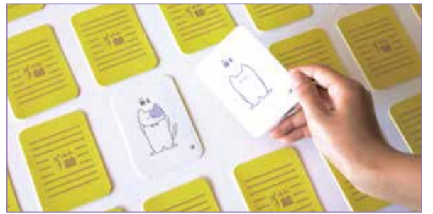
カードゲーム「猫に小判」石川県教育委員会賞

金城短大では課題を与えられるだけではなく、自分で企画する事もあります。特に、公開オーディションという授業では自分で企画や取材も行い、最終的には先生やプロのデザイナーの方の前でプレゼンテーションを行います。初めは何を作ればいいのか中々思いつかなかったのですが、次第にやりたいことが見えてきてなんと4回あるオーディションをやりきることができました。