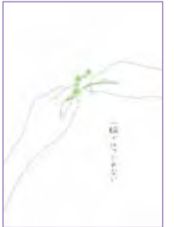
「輪」ポスター 第10回ポスターグランプリ 入賞作品

将来は学んだことを活かし、1人前のデザイナーになり様々な人を笑顔にできるものを作っていきたいです。