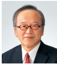
学長 米島 學

2000(平成12)年に社会福祉学部のみ単科大学として開学した金城大学は、3学部5学科・1研究科・1専攻科を擁する大学に発展しました。また現在は、総合経済学部(仮称、設置認可申請中)の2024(令和6)年度開設に向けた準備を着々と進めています。